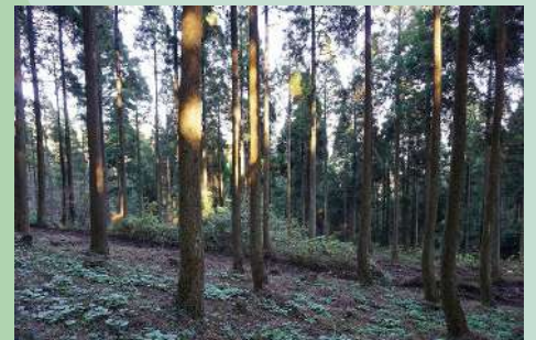
杉の足元に葉わさびも育つ美しい森の中 森林浴しながら散策します☆

● オプション リース作り (500円) 森の恵みをいただき、リースづくり☆ 森の記憶をお家に飾りませんか？と